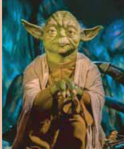
יודה מ"מלחמת הכוכבים". ניצול דמויות?