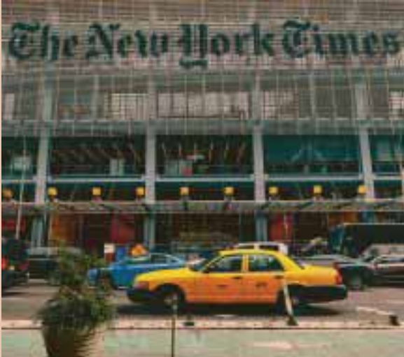
משרדי הנ"ל יורק טיימס. שימוש בכתבות